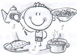
НЕ ПРОПУСКАЙТЕ ПРИЕМЫ ПИЩИ