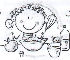
СЛЕДУЙТЕ ПРИНЦИПАМ ЗДОРОВОГО ПИТАНИЯ И ВОСПИТЫВАЙТЕ ПРАВИЛЬНЫЕ ПИЩЕВЫЕ ПРИВЫЧКИ