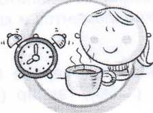
СОБЛЮДАЙТЕ ПРАВИЛЬНЫЙ РЕЖИМ ПИТАНИЯ